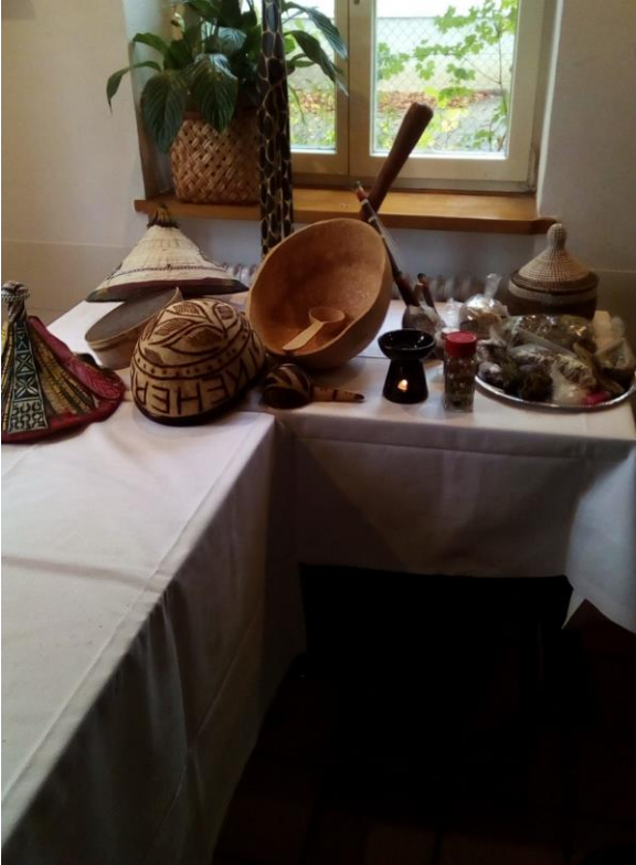
Gegenstände des täglichen Lebens zierten das ...