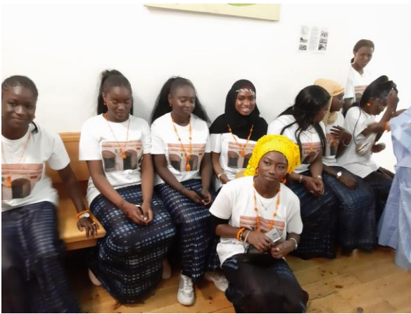
Die jungen Mädchen boten eine 3-sprachige Darbietung, die Frauen zeigten ihre traditionelle Tracht