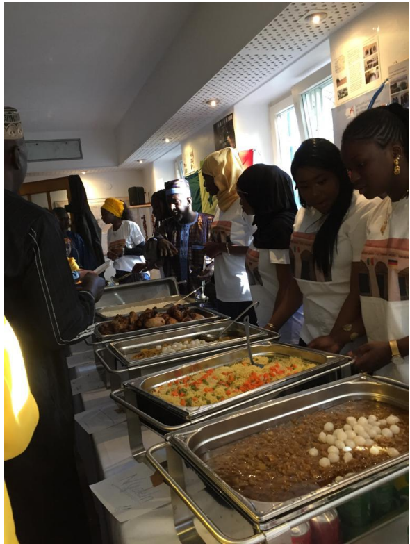
Mittagsbüfett mit drei warmen Gerichten ..